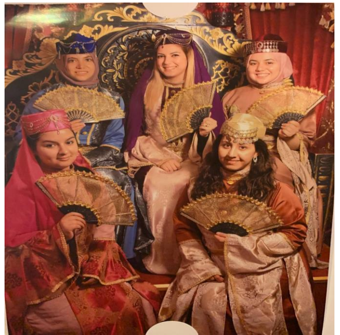
Galata Kulesi'nde ydik.