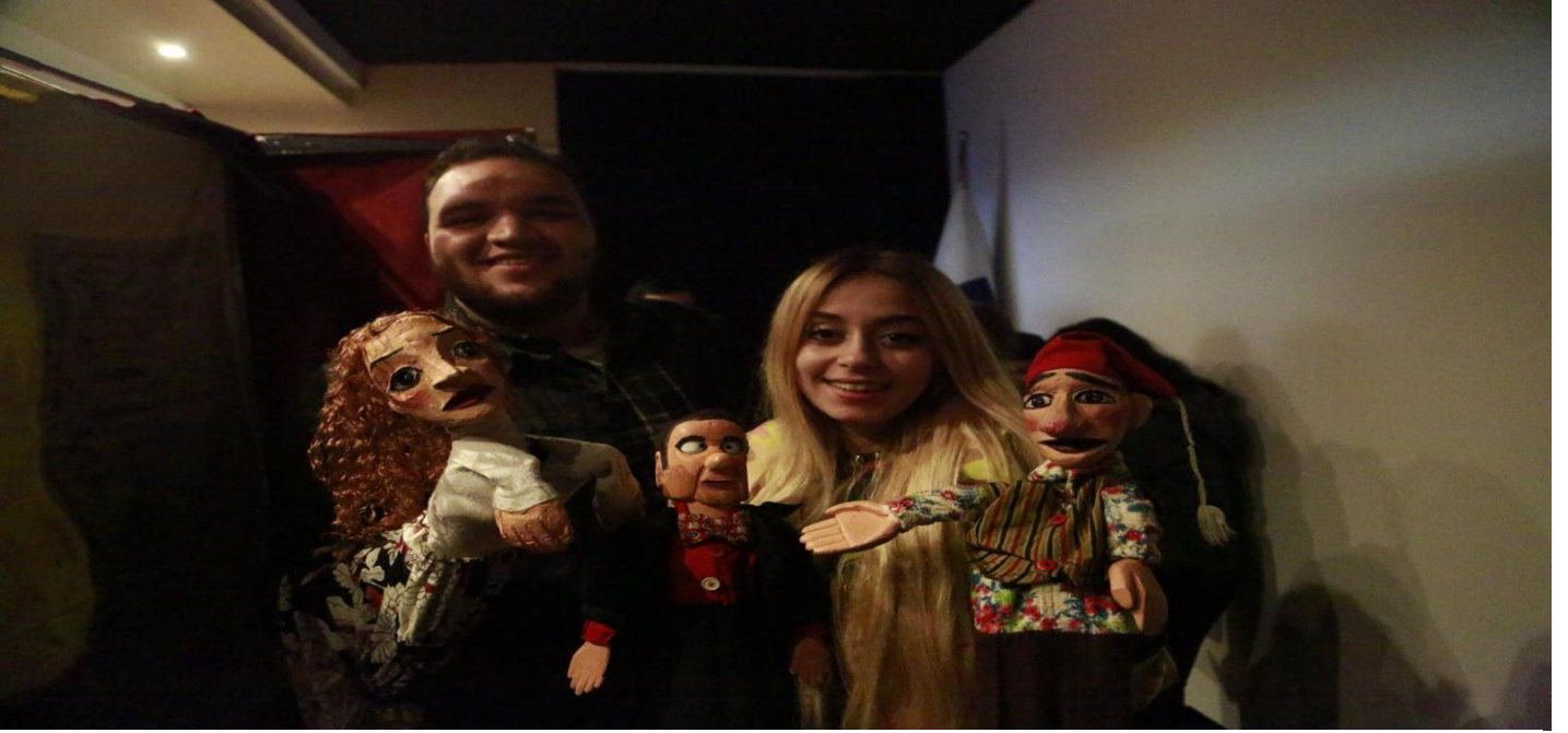
Öğrencilerimiz hep birlikte keyifli vakit geçirdiler.