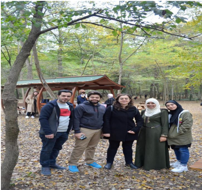
Belgrad Ormanı'nda piknikteydik.