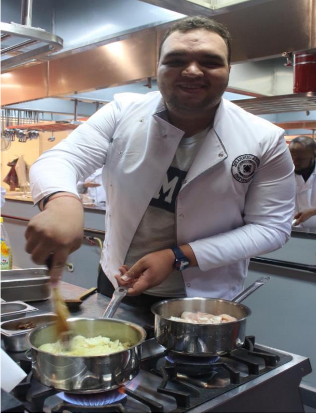
Filistinli öğrencimizden Filistin mutfağına özgü bir yemek yapımı