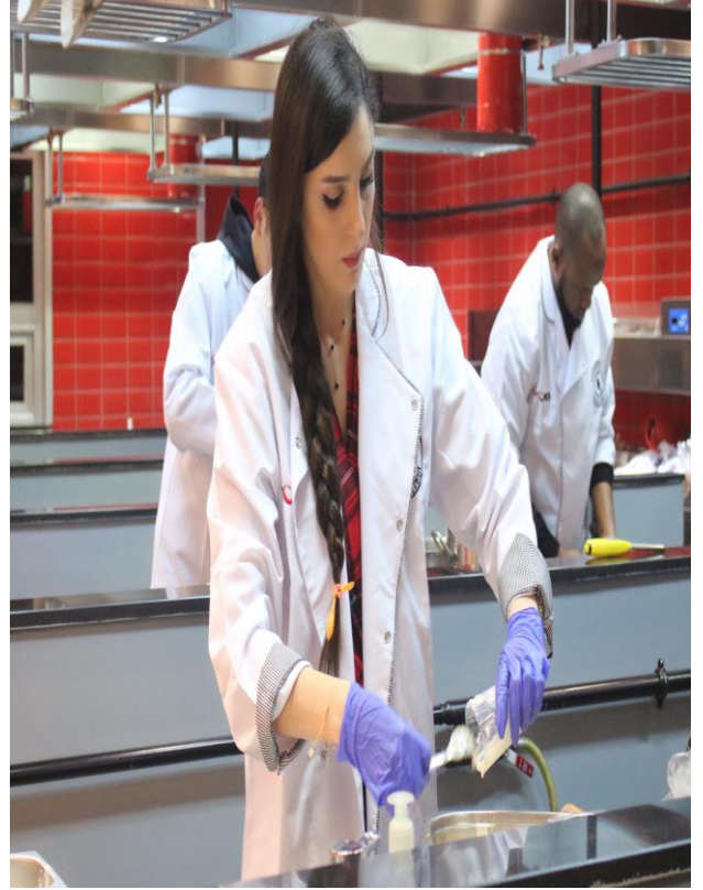
İranlı öğrencimizden İran mutfağına özgü bir yemek yapımı