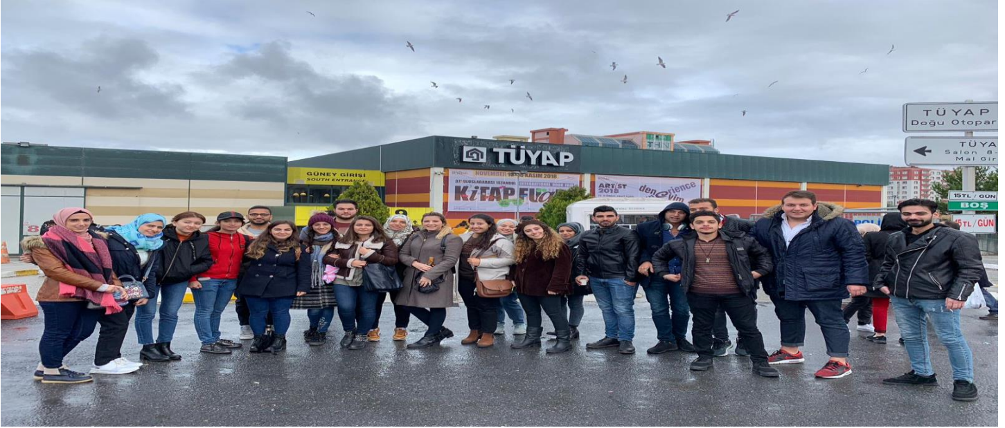
TÜYAP Kitap Fuarı'na ziyarette bulunduk.