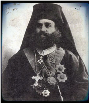
Samsun/Amasya Metropoliti Germanos Karavangelis

Καυνακ: Βλάσης Αγτζίδης, Έλληνας Του Πόντου , Τομος Β, Αθήνα, 2009, σ. 90.