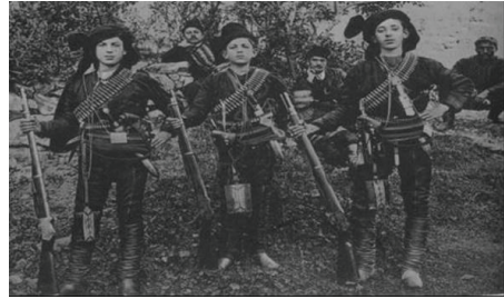
Κüçük Yaştaki Eli Silahlı Rumlar

Καυνακ: Βλάσης Αγτζίδης, Έλληνας Του Πόντου , Τομος Β, Αθήνα, 2009, σ. 119.