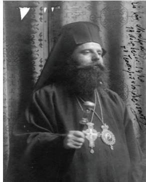
Trabzon Metropoliti Hrisantos