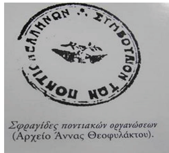
Pontus Teşkilatı Mührü