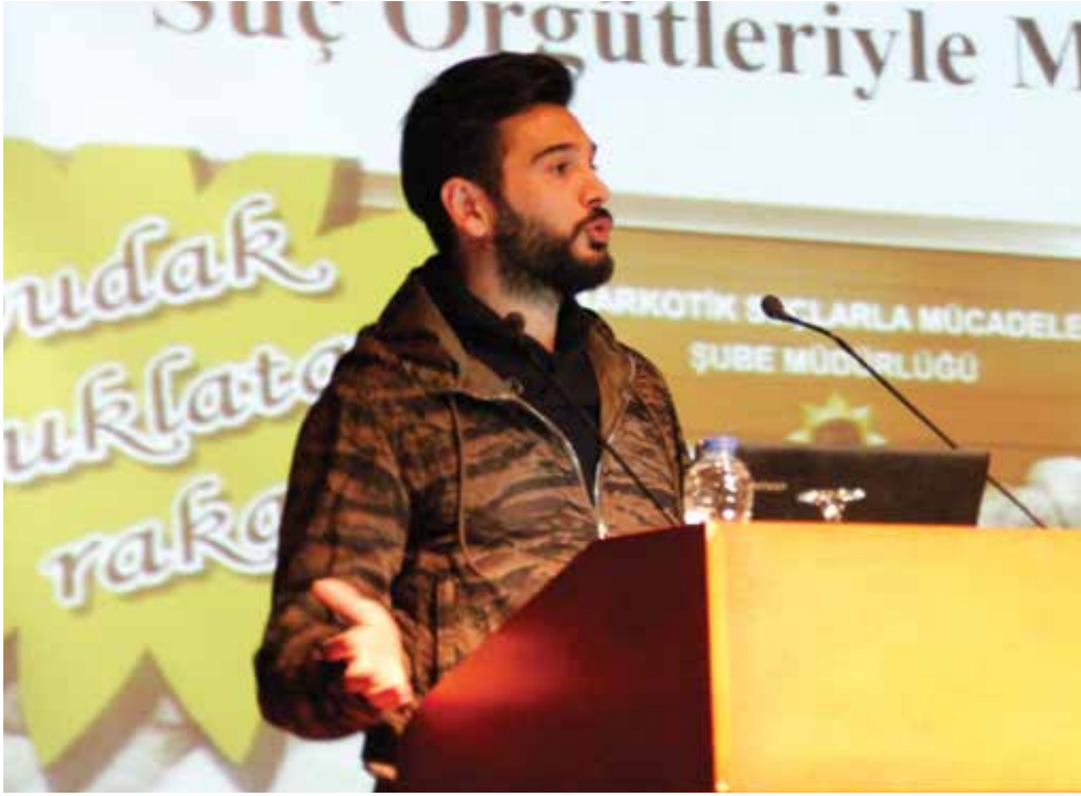
Başkomiser Mehmet KURT

Arkadaşlar, 140 bin adet silah; bu silahlar uzun namlulu silahlar. Biz her zaman Türkiye’de şunu söyleriz, polise karşı bir hırsız, silah kullanmaz. Bize karşı bir gaspçı silah kullanmaz. Polise ve askere karşı kullanmazlar. Polise ve askere silah kullanan sadece uyuşturucu kaçakçıları. Çünkü uyuşturucu kaçakçıların terör ile bağlantısı vardır ve çok yüksek meblağlarda para olduğu için, bundan hiçbir zaman vazgeçmezler. Bizim yakaladıklarımız onların malları; biriktirmiş oldukları tüm mallarıdır. Biz bir ton eroin yakaladığımızda ya da bir ton esrar yakaladığımız zaman, onun için hayat bitmiş demektir. Çünkü tek değil. Üç beş kişiler. Sen ispiyonladın, ailene zarar veririz gibi tehditlerde bulunurlar. Bizi de umursamazlar. Askeri de umursamazlar, bizlere de zarar verirler. Can güvenliğimiz bizim için son derece önemlidir. İsim vermeyeceğim, bir ilçemizde torbacılar birbirine girdi, dokuz kişiyi vurdular. Neden? Bir mahalleyi paylaşmıyorlar. Biz sabah altıya kadar operasyon yaptık kalaşnikoflarla. Umurlarında bile değil.