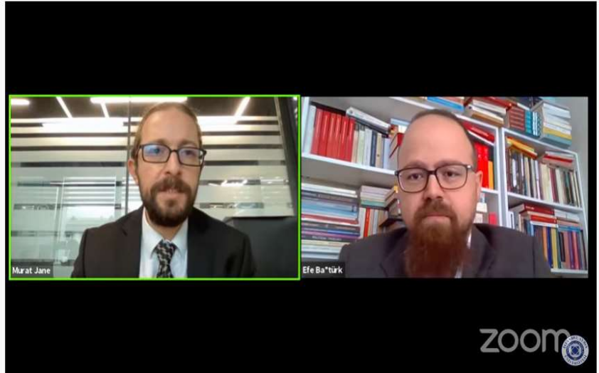
21. Yüzyıl'da Demokrasi ne Durumda?