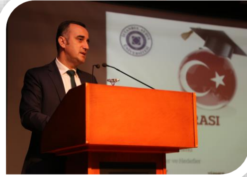
Türkiye Ulusal Ajansı Başkanı Sn. Mesut Kâmioloğlu