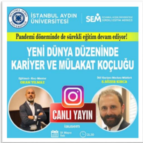
Etkinlik Tanıtım Afışı