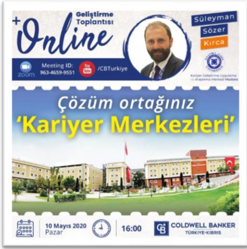
Etkinlik Tanıtım Afışı

-Webinar Instagram Uygulaması üzerinden gerçekleştirilmiştir.