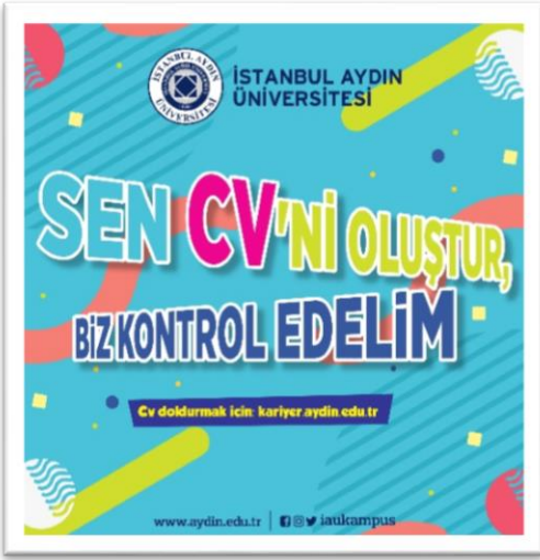
Proje Tanıtım Afışı

Özgeçmiş, neyi ne kadar bildiğinizi, neler yapabileceğinizi ifade eden, potansiyelinizi yansıtabileceğiniz, kendinizi en iyi şekilde karşı tarafa anlatmanız gereken sunumdur. Kariyer Geliştirme Uygulama ve Araştırma Merkezi olarak Nisan 2020’den itibaren Covid-19 pandemi sürecinde öğrenci ve mezunlarımızın CV’lerini kontrol etmek ve düzenlemelerde bulunmak adına bu projeyi hayata geçirdik. Öğrenci ve mezunlarımızdan “kariyer.aydin.edu.tr” sayfasına girerek CV’sini oluşturmasını veya güncellemesini, ardından “kariyermerkezi@aydin.edu.tr” adresine öğrenci numarası veya TC Kimlik numarası ile birlikte mail olarak göndermelerini sağladık.