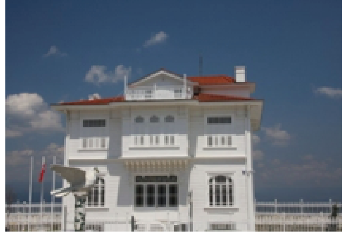
Mudanya Ateşkes Antlaşması'nın imzalandığı Konak

başlamış, Türk tarafının istekleri bu kez büyük ölçüde kabul edilip 11 Ekim 1922'de ateşkes imzalanmıştır. 14 Ekim 1922'de Yunanistan'ın İstanbul'daki temsilcisi Yunanistan tarafından imzalanmamış antlaşmanın kararlarına razı olduklarını açıklamıştır.