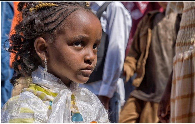
Bet Giyorgis Kilisesi, Lalibela, Etiyopya, Ocak 2012