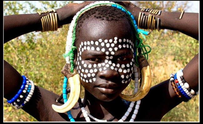
Mago Ulusal Parkı, Etiyopya - Ocak 2012