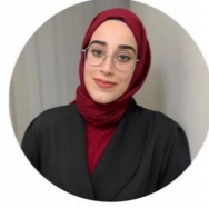
Nida Nur ÇEBİ Youtuber