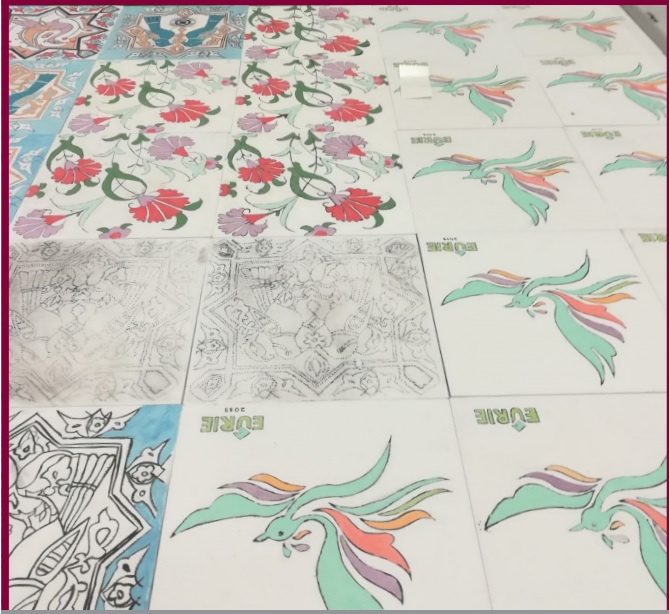
Çini atölyesi çalışmaları (sırlama öncesi)