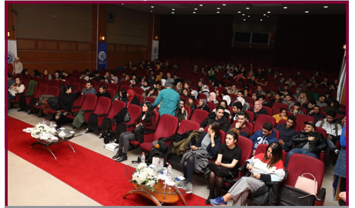
2. Uluslararası Moda Ekspresi Ebru Workshop'a katılım sağlayan TÖMER öğrencileri

2. Uluslararası Moda Ekspresi Ebru Workshop'ta Tömer öğrencilerinin Ebru çalışması