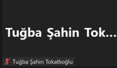
Tuğba Şahin Tokatlıoğlu