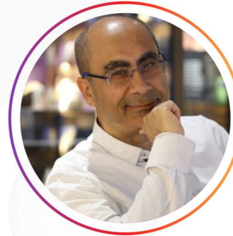
Konuşmacı Derviş ZAIM Film Yönetmeni