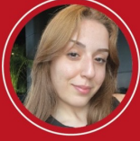
Nida Özkan yazdı

“ Halkla İlişkiler Uzmanı Sosyal Medyayı Nasıl Kullanmalı?