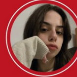
Aleyna Telloğlu yazdı