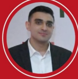
Mehmet Emre Yılmaz yazdı

“ Spor Kulüplerinin Sosyal Medya Üzerinden İletişim Biçimleri