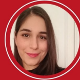
Melisa Ece Şeker yazdı

“ Marka Sadakatinin Oluşmasında Halkla İlişkilerin Rolü