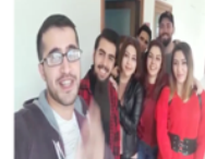
18.03.2018 Dışarı Başlayan Grup Meslekleri Meslekleri