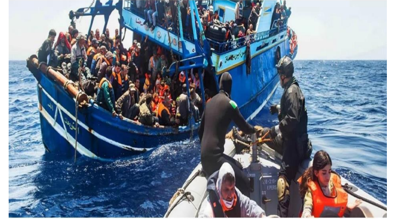
MIGRANT SMUGGLING AND TERRORISM CONNECTION ON MIGRATION ROUTES

Terörizm ve Radikalleşme ile Mücadele Araştırma Merkezi