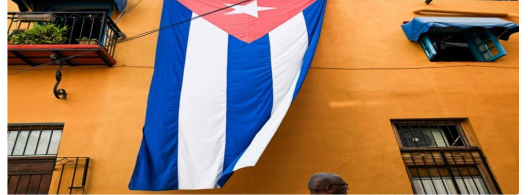
A man walks past a Cuban flag hung on the facade of a house, Havana, Cuba, March 26, 2026.