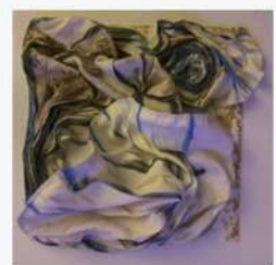
HAVVA MERYEM İMRE