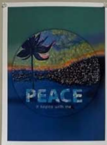
Illustration: Sakae's Illustration Design / Aki Nakamura