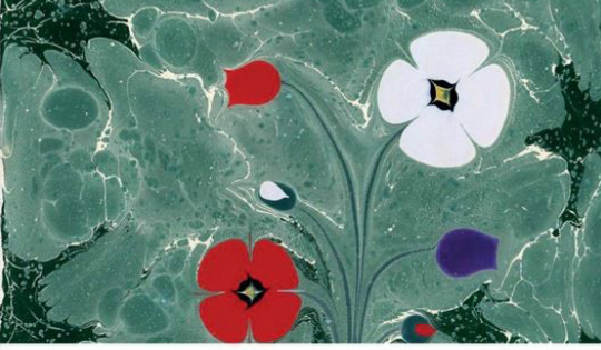
Söyleşi Fuat Başar

Tarih: 20 Aralık 2017 Saat: 15.00-16.00 Yer: Galeri Aydın