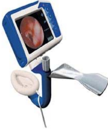
Şekil 1. LMA-C Trach