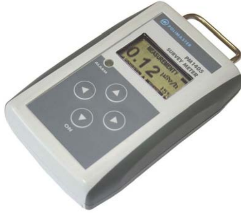
Şekil 1. Polimaster Survey Meter PM1405 detektörü