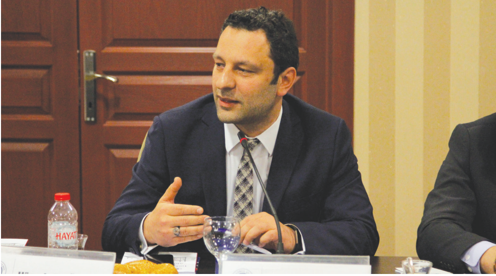
Av. Uğur YILDIRIM