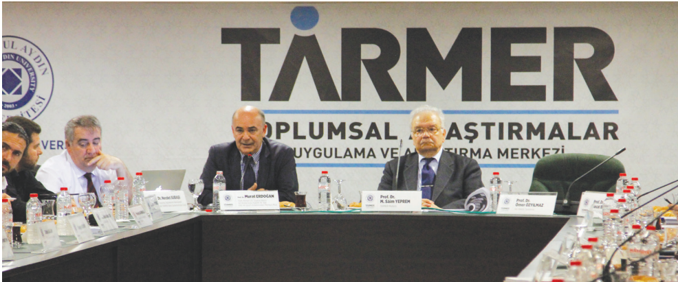
Türkiye'de Bulunan Geçici Koruma Altındaki Suriyeliler Çalıştayı

düzenlemesini içeren bu adım; uzun bir aranın ardından yeniden atılmıştır. Yasanın ardından da; ülkemizle gönül ve kültür bağı olan coğrafyalardan insanlar, Türkiye topraklarına göç etmeye devam etmiştir. Söz konusu yasalar, göç eden insanları ülkemize entegre etmeyi planlamış ve bu önemli hedef de büyük ölçüde gerçekleştirilmiştir. Dolayısıyla günümüzde herkesin ya yakın bir akrabasının ya da komşusunun göçmen olduğunu söyleyebiliriz. Bu insanlar Arnavut kökenli, Boşnak kökenli, Azeri kökenli olabilirler ya da diğer etnik kökenlerden gelebilirler. Orta Asya'dan Orta Doğu'ya kadar pek çok yerden göç eden bu insanlar, aslında Türkiye Cumhuriyeti'nin insanları çeşitlendirme sürecinin birer parçasıdır. Bu açıdan bir taraftan 'homojenize etme', diğer taraftan da 'çeşitlendirme' konusunda bir başarıya ulaşıldığı söylenebilmektedir.