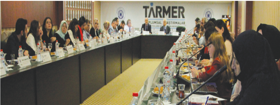
İAÜ - Aydın Düşünce Platformu Toplantı Salonu

Sürekli olarak ‘Suriyeli mülteci’ ifadesini kullanıyoruz; fakat buna da kısa bir açıklama getirmemiz gerekmektedir. Bir taraftan dünyada en fazla mülteci barındıran ülke olmakla övünmekteyiz, diğer taraftan da Türkiye’deki Suriyelilere kanunen ‘mülteci’ diyememekteyiz. Çünkü Türkiye’de sistem, ‘mültecilik’ kavramını dörde bölmüş durumdadır. Ülkemizde ‘mülteci’ ifadesi, 1951 Cenevre Antlaşması’na göre sadece Avrupa’dan gelen göçmenleri içermektedir; fakat bunun mantığı artık değişmiştir. Keza bu durum; vicdana da, ahlâkî normlara da uymamaktadır. İran’dan gelene “Mülteci değilsin!” deyip Romanya’dan gelene “Mültecinin.” demek tutarlı bir durum değildir.