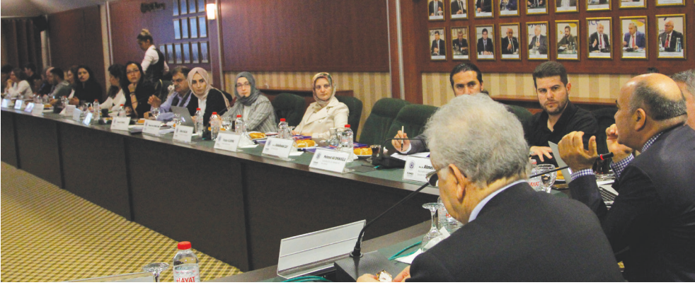
Birinci Oturum - Açılış Sunumu

Dünyada toplam 250 milyon civarındaki göçmenin % 80'inden fazlası, gelişmiş ülkelerde yaşamaktadır. Bunun nedeni ise gelişmiş ülkelerin, insan kaynağı için yeterli alt yapıya sahip olmalarıdır. Türkiye'de de göçmenler gelişmiş kentlere; İstanbul'a, Bursa'ya, İzmir'e gelmekte ve bu insanların o illere büyük bir katkısı olmaktadır. Mültecilere geldiğimizde ise durum tamamen değişmektedir. Dünyada 65 milyon civarında mülteci bulunmakta ve bunun sadece % 15'i gelişmiş ülkelerde yaşamaktadır. Geriye kalanlar ise, ekonomik düzeyi düşük coğrafyalarda veya komşu ülkelerde yaşama tutunma gayreti göstermektedirler.