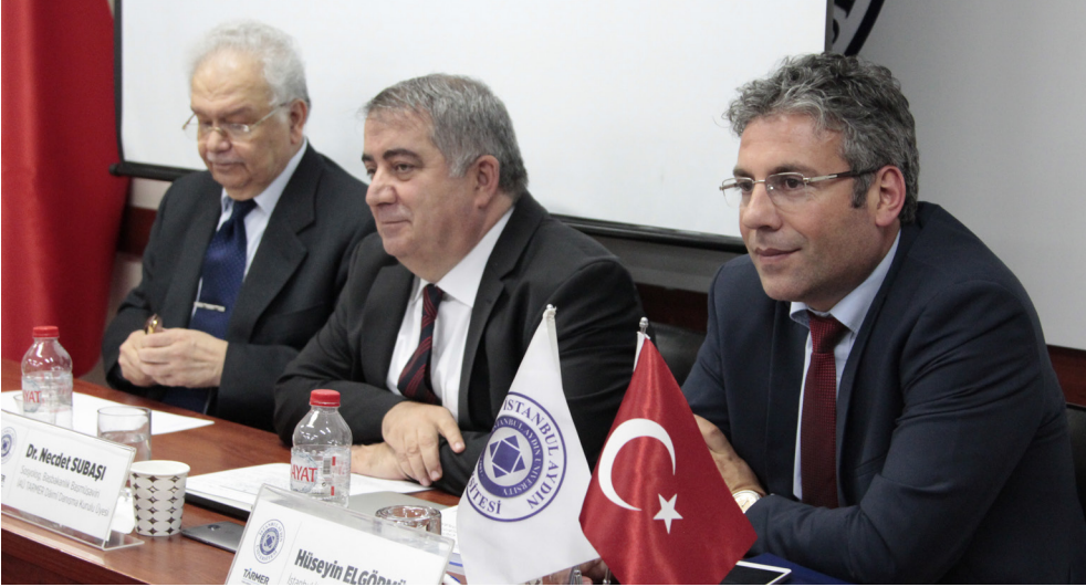
Türkiyede Bulunan Geçici Koruma Altındaki Suriyeliler Çalıştayı

bir dikkatle, burada neler olduğuna ilişkin bir gözlemim mevcuttur. Rapor düzeyinde, elimden geldiğince, ki şimdiye kadar 25-30'u bulmuştur; ulusal ve uluslararası sonuçların tamamını okudum. Bunların içerisinde bizim raporları gölgede bırakan çok dikkatli, özenli yabancı raporlar olduğu gibi; bizim Türk üniversitelerinde üretilmiş, hatta bırakın üniversiteyi, doğrudan STK'lar tarafından yapılmış dört dörtlük düzeyde güzel raporlar da bulunmaktadır. Yani olayın tahlilinde bir sorun yoktur ve olay çok iyi kavranmış durumdadır. Kimin ne yaptığı herkes tarafından bilinmektedir; ama gördüğümüz gibi, önümüze bir türlü doğru dürüst bir sonuç gelmemektedir. Bunun da ayrı bir sosyolojik boyutu bulunmaktadır. Ayrıca devletin yapısıyla ve sistemle ilgili birtakım tartışmalar da yapılmaktadır.