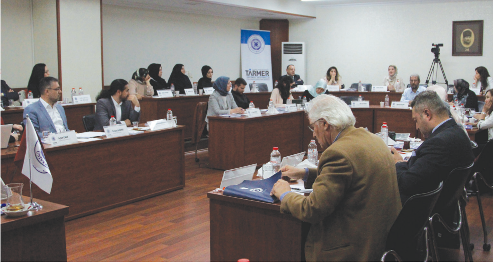
İAÜ - Halit Aydın Kampüsü

(Kadın ve Demokrasi Derneği KADEM - Uzman)