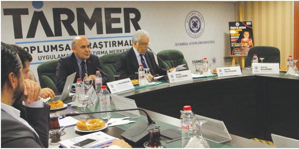
9 Mayıs 2018 - İAÜ Halit Aydın Kampüsü

Üçüncü neden ise İran'da bulunan, 3 milyon civarındaki Afganlı mültecilerdir. İran, politik olarak hem Türkiye'ye hem de Avrupa'ya karşı mültecilere baskı yaparak bu durumu kullanmaya başlamıştır ve Avrupalılara yönelttiği "Türkiye'ye, Suriyeli mültecileri ülkelerinde tutmaları için para veriyorsunuz. Bizim ülkemizde de 3 milyon Afgan mülteci var. Bize neden para vermiyorsunuz?" söylemleriyle muhalif bir tutum sergilemektedir. Bu tutum yüzünden de İran'dan Türkiye'ye göç eden insanlar olmaktadır. Ancak kanaatim odur ki; temel sebep, Türkiye'nin Suriyeliler konusunda uyguladığı mülteci politikasının göçmenlere cazip gelmesidir. Durum böyle olunca; sadece Suriyelileri değil, Suriyeli olmayan göçmenleri de konuşmamız gerekmektedir.