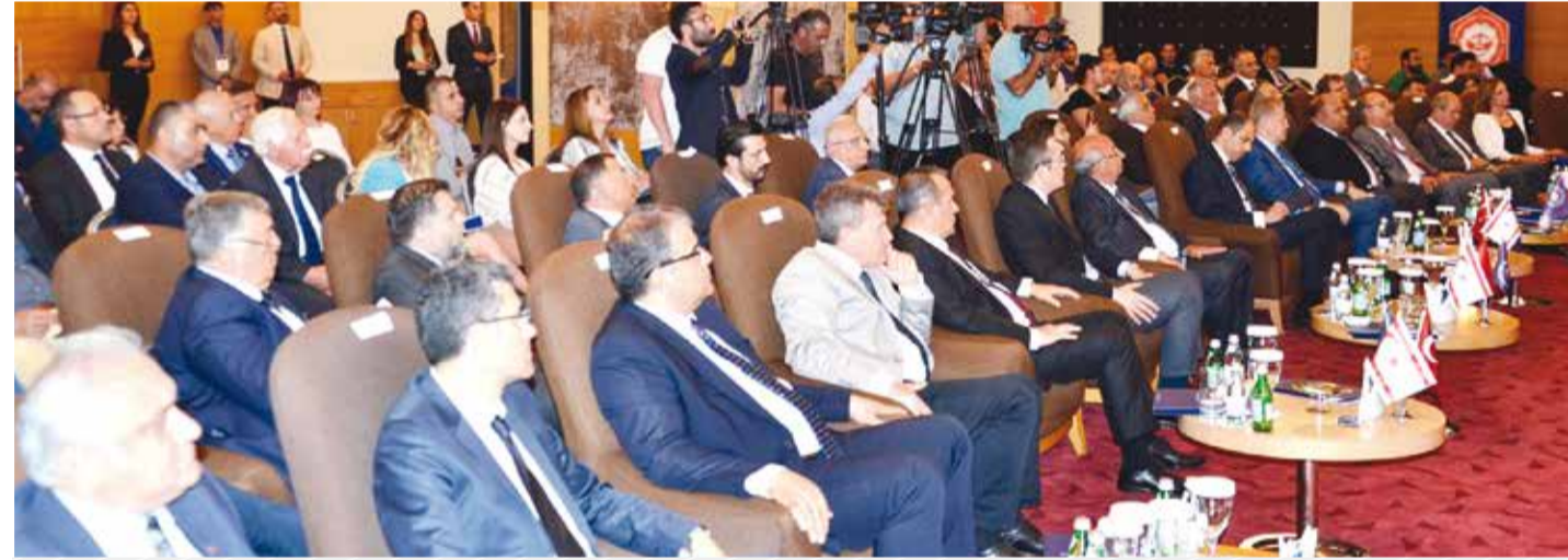
Kıbrıs İlim Üniversitesinde düzenlenen konferansta, son dönemde suların ısındığı Doğu Akdeniz'in küresel gelişmeler açısından önemi ve Türkiye'nin pozisyonu ele alındı.

The importance of the Eastern Mediterranean where problems has been breaking out lately in terms of global developments and the position of Turkey on this subject were discussed at the conference held at Cyprus Science University.