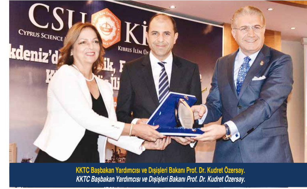
KKTC Başbakan Yardımcısı ve Dışişleri Bakanı Prof. Dr. Kudret Özersay, KKTC Başbakan Yardımcısı ve Dışişleri Bakanı Prof. Dr. Kudret Özersay.