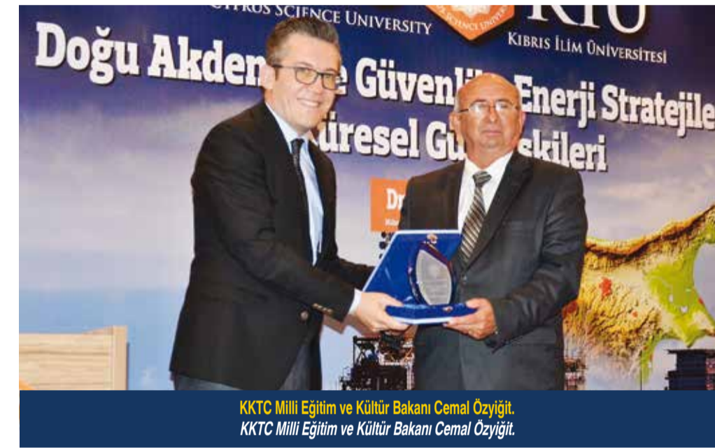
KKTC Milli Eğitim ve Kültür Bakanı Cemal Özyiğit, KKTC Milli Eğitim ve Kültür Bakanı Cemal Özyiğit.