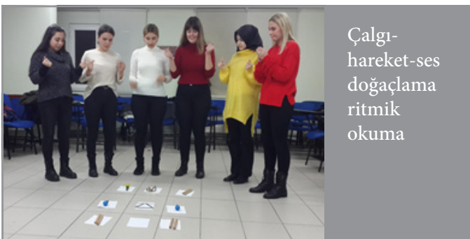
Çalgı-hareket-ses doğaçlama ritmik okuma