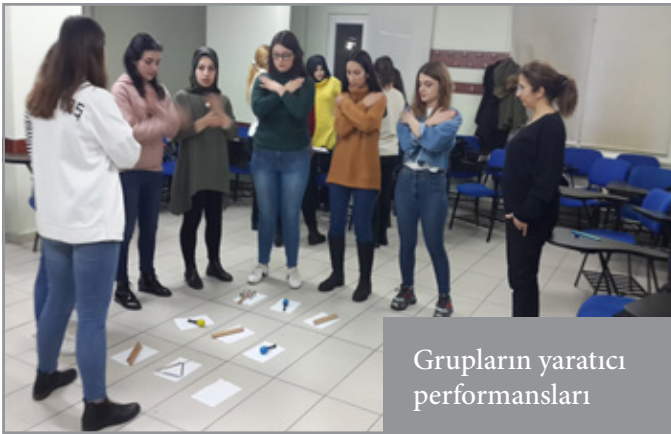
Grupların yaratıcı performansları