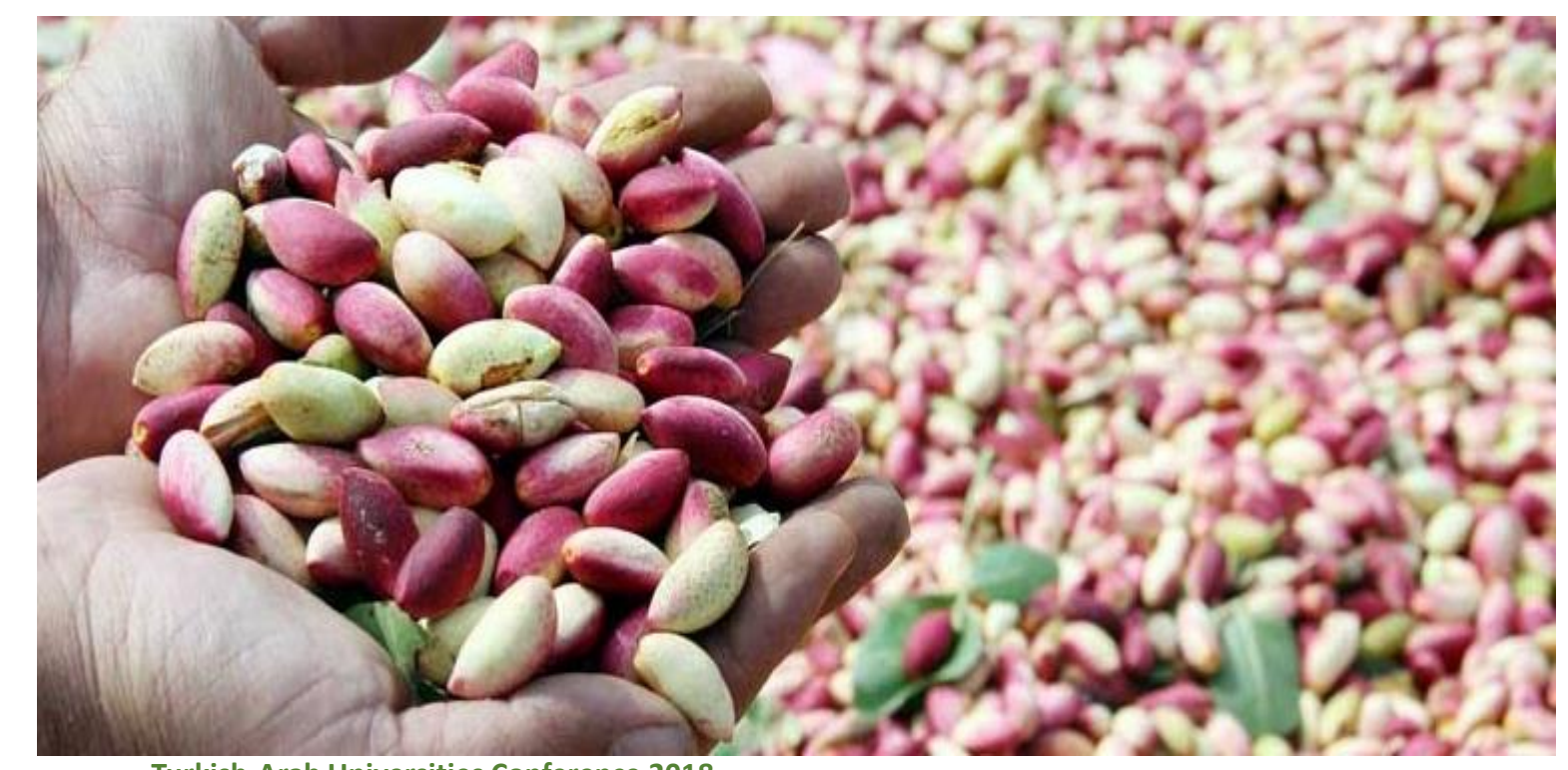
Turkish-Arab Universities Conference 2018

There are nearly 50 millions of pistachio trees in the region.