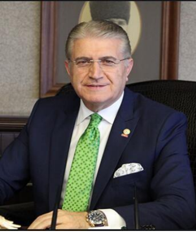
Mütevelli Heyet Başkanı