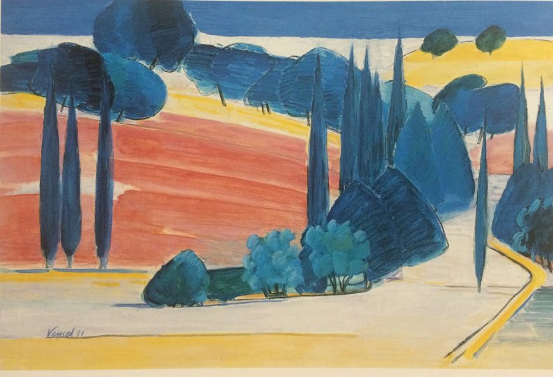
Ege'den / From the Aegean, Tuval yağlıboya / Oil on canvas, 80 x 120 cm, 1991