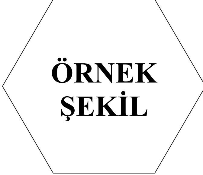
Şekil 4.1 : Örnek Şekil

Stet clita kasd gub rgren, no sea takimata sanctus est Lorem ipsum dolor sit amet, consetetur sadipscing elitr, sed diam nonumy eirmod tempor invidunt ut lab ore sit et dolore magna.