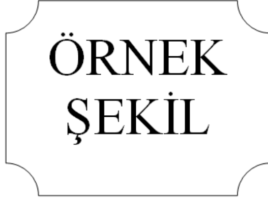
Şekil 5.1 : Beşinci Bölümde Örnek Şekil

This indicates that the ANN is accurate at base flow and flow height values lower than 3 m.