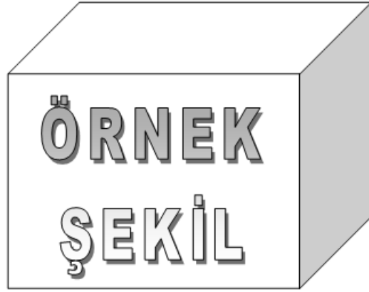
Şekil 1.1 : Model Yapıları

diam nonumy eirmod tempor invidunt ut lab ore sit et dolore magna. Stet clita kasd gub rgren, no sea takimata sanctus est.