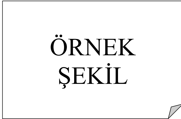
Şekil 3.1 : Sınır Hücresi